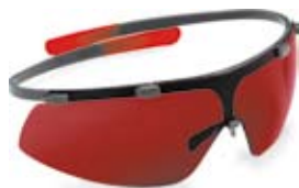
GLB30 Gafas ligeras Nº. art. 723 777 3 en 1 para ver el punto láser con tres tipos diferentes de gafas: para ver el punto láser, de seguridad y para el sol