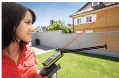
Determine la distancia horizontal, aún con obstrucciones, por medio del sensor de inclinación.