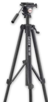
Trípode Leica TRI 100 Nº. art. 757 938 Trípode de calidad con ajuste fino de gran sencillez