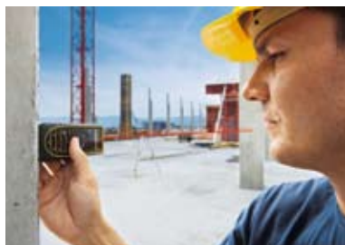
Medición de grandes distancias con Power Range Technology™ de Leica Geosystems.

Hace más de 15 años, Leica Geosystems presentó el primer distanciómetro láser y revolucionó el mercado mundial de este segmento. Desde entonces hemos establecido los estándares de productividad para la medición con tecnología avanzada. Un espíritu de constante innovación impulsa a nuestros ingenieros altamente motivados a continuar desarrollando nuevas ideas, ofreciendo a nuestros clientes productos robustos, fiables y de gran precisión. Leica DISTO™ facilita las tareas diarias de nuestros clientes.