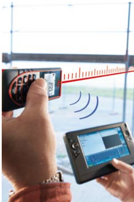
Medición de distancias en pocos segundos para usarlas de inmediato en su PC o PC de bolsillo.