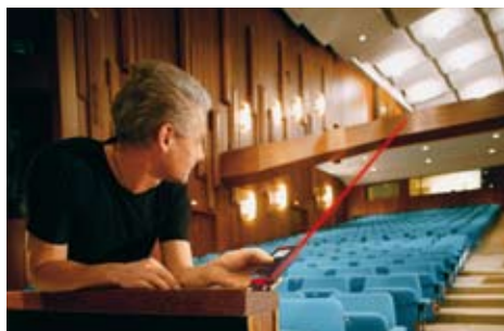
Medición de dimensiones aún en lugares inaccesibles.