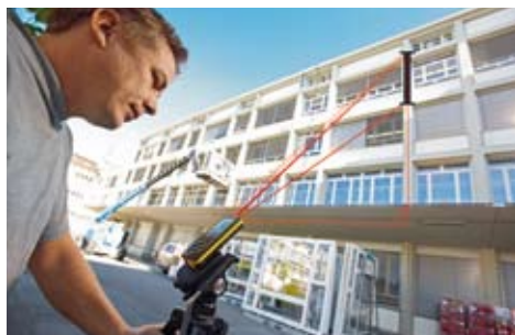
Medición indirecta de alturas: determine la altura de ventanas con la función pitágoras.