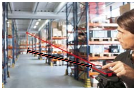
Smart Horizontal Mode™ – medición de distancias horizontales, aún con obstrucciones.

El Leica DISTO™ D3a BT tiene las mismas características que el DISTO™ D3a pero además, ofrece las siguientes ventajas: